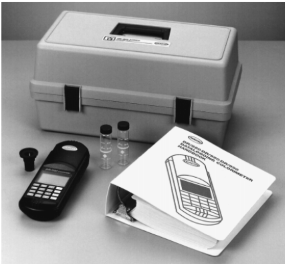
图 1 DR/800 系列色度仪标准包装*